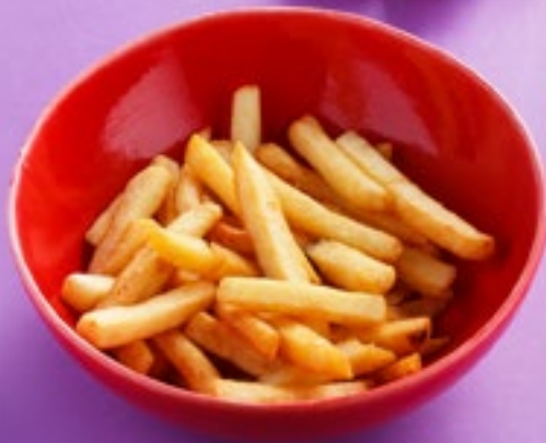
КАРТОФЕЛЬ ФРИ French fries