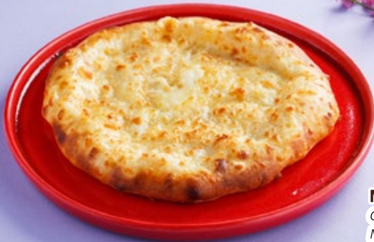
МЕГРЕЛИК Cheese khachapuri Megreli style