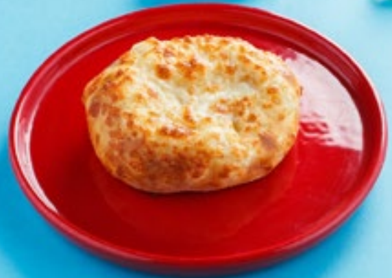
ДЕТСКИЙ ХАЧАПУРГЕР Khachapurger