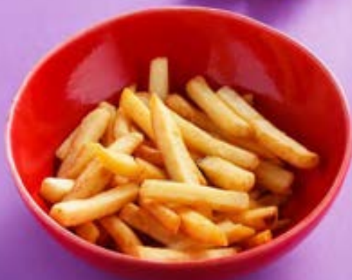
КАРТОФЕЛЬ ФРИ French fries