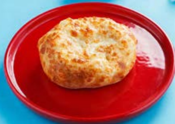
ДЕТСКИЙ ХАЧАПУРГЕР Khachapurger